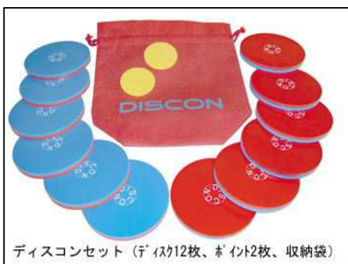
ディスコンのセット