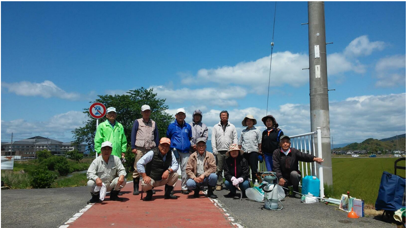
『はなの会』 第15回 地域活動に参加された方々 平成30年5月10日

平成30年5月10日（木）午前9時より11時00分まで白鳥川沿いのヨシ笛ロード（約300mの長さ）のフェンス側の除草及び薬剤散布また片側で花が散ったスイセン周りの除草作業をしました。参加者は13名で風の強い4月上旬頃の気温で冷たく感じました。