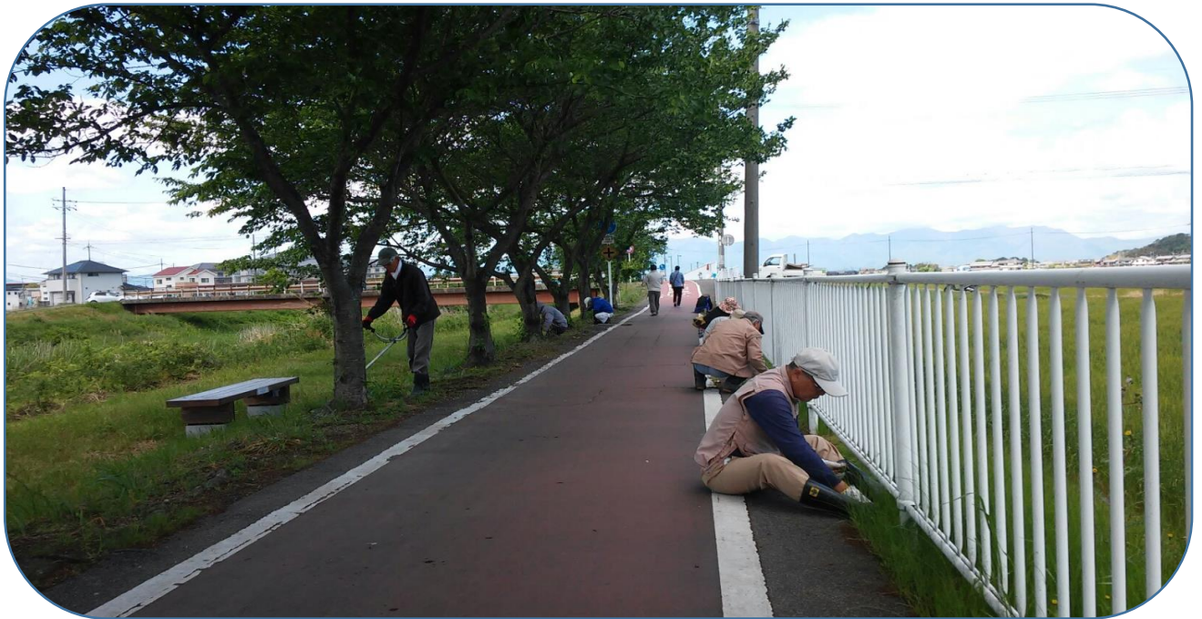
スイセン周りの除草及びフェンス側の除草