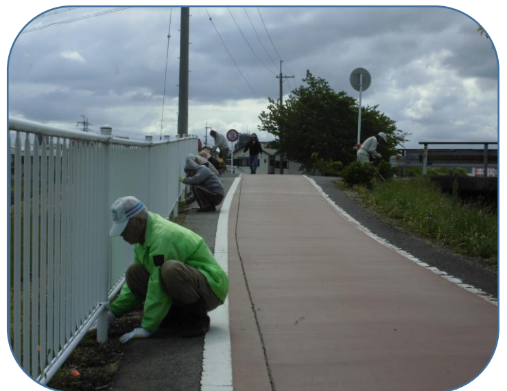
フェンス側の除草作業